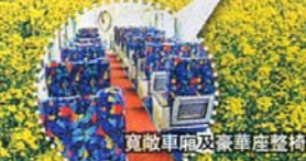
寬敞車廂及豪華座椅