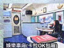
娛樂車廂(卡拉OK包廂)

彩繪車身的「台灣專列環島之星」，的確令人聯想到是寶島版的豪華專列「東方快車」，或者是傲遊汪洋的郵輪。全架專列8個車廂，有齊觀景餐飲卡、娛樂卡、頭等包廂座等等，而頭等包廂上更有專屬員工提供餐飲、講解等服務，齊全完備的設施令大家享受到更舒適的旅程。