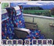
寬敞車廂及豪華座椅